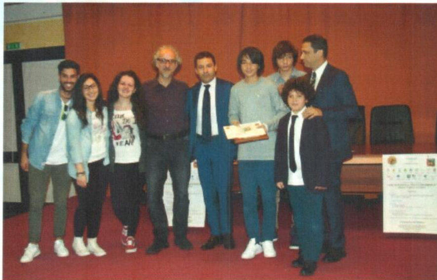
Concorso interregionale (Basilicata, Calabria, Campania e Puglia) UGUAGLIANZA NELLA DIVERSITÀ - Premio Tomaso Viglione Vincitori IX Edizione, 2016: classe IV e VAT del I.I.S.S. Gorjux -Vivante di Bari