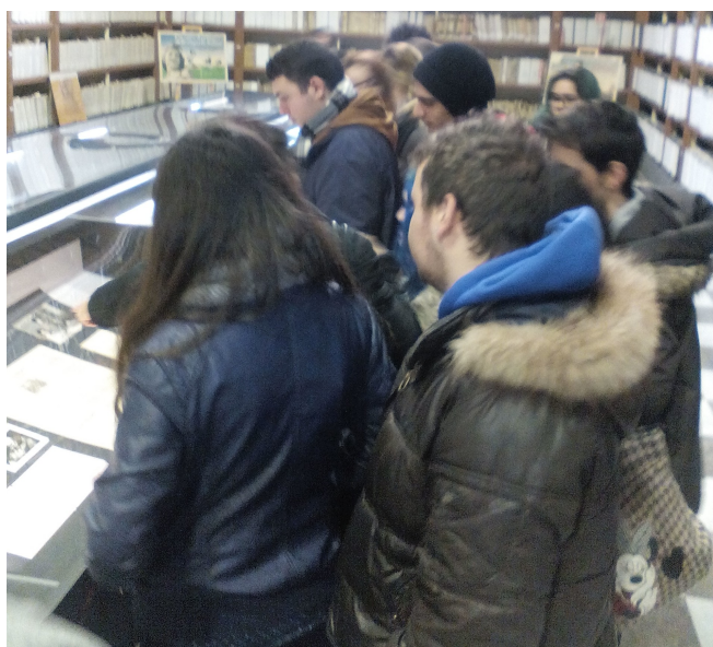
Classe 3H Liceo Musicale