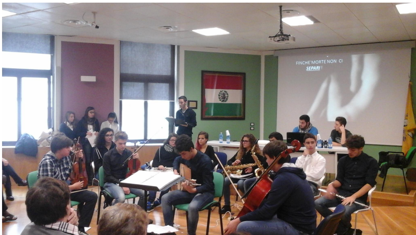
Esibizione del gruppo strumentale della classe 3 ^ G in occasione della manifestazione del 25 Novembre 2015 presso L'Aula Magna dell'Istituto V.E. III di Palermo

Manifestazione del 1 Dicembre 2015 Giornata Mondiale per la lotta all'AIDS