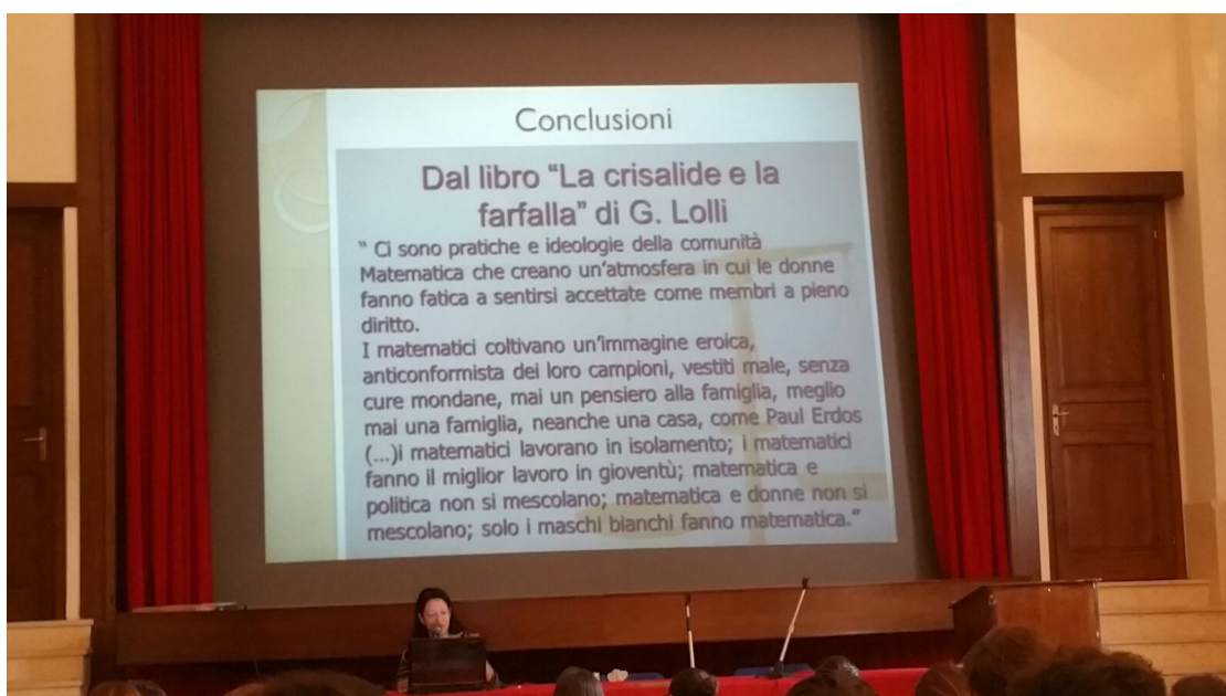
LA DONNA NELLA MATEMATICA TRA PASSATO, PRESENTE E FUTURO